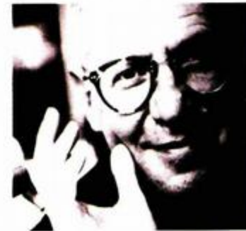
Prof. Wolf Prix